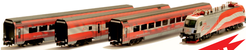
HO25213 175 Jahre Railjet Sonderlackierung. Set mit Lokomotive.