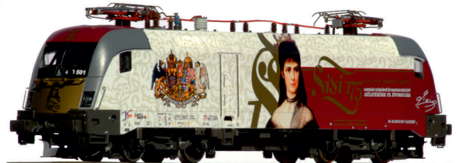
60060 470.501 GySEV Sonderlackierung zum 175. Geburtstag der Kaiserin Sisi von Österreich, Königin von Ungarn