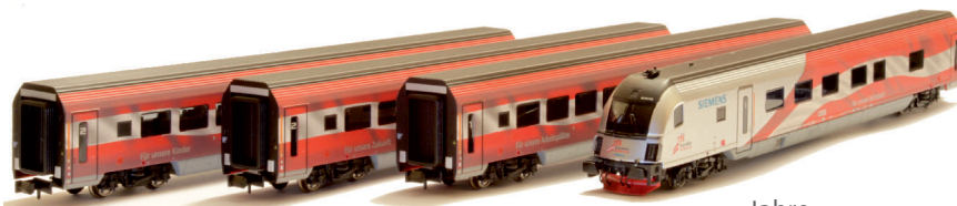
HO25212 175 Jahre Railjet Sonderlackierung. Set mit Steuerwagen. Beide Artikel können nur gemeinsam abgegeben werden.