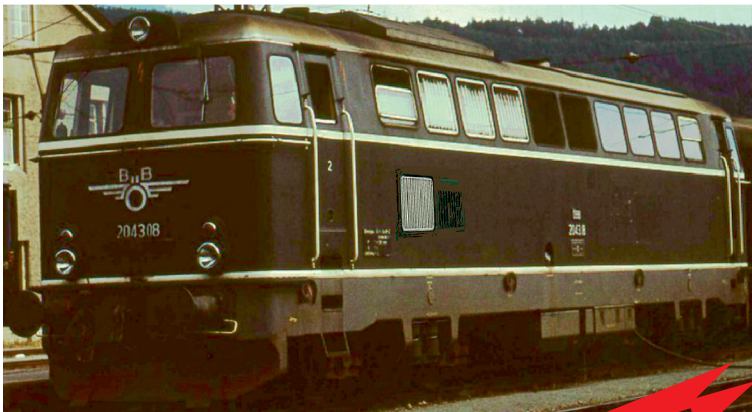
60050 2043.08 Ep III/IV In klassischer tannengrüner Farbgebung