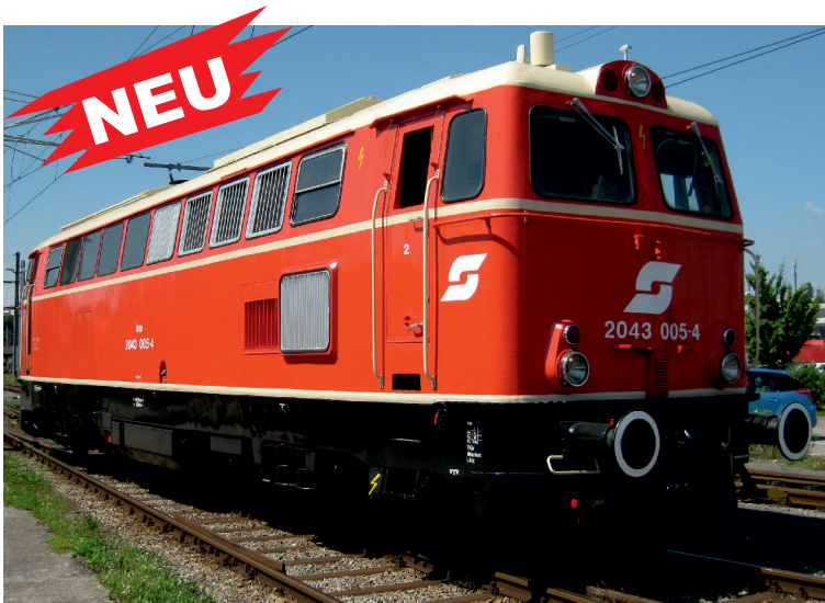
60030 2043.005 Ep IV/V In klassischer blutoranger Farbgebung