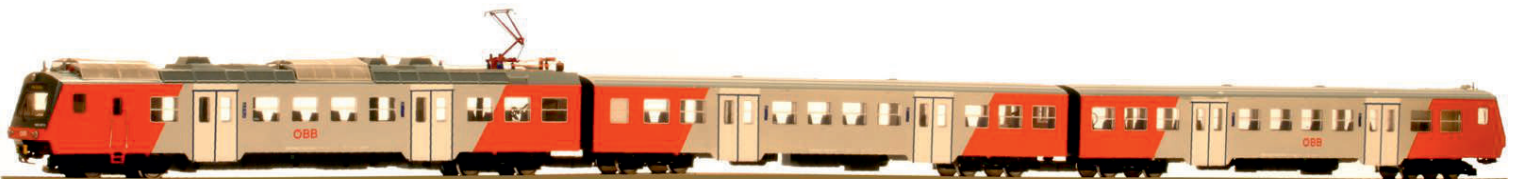
4020.296 Ep VI BASIC Edition

Garnitur im City Shuttle Schrägdesign. Modell mit 21pin Schnittstelle, Lichtwechsel in Lok und Steuerwagen