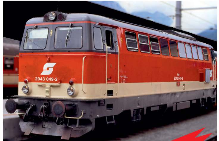
60070 2043.049 Ep VI Im beige / roten Valousek Design