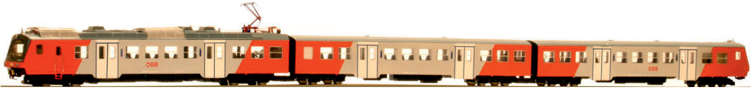
4020.297 Ep VI HIGH END Edition

Bitte beachten, dass für die Steuerung der Zugzielanzeige, Dekoder mit einem 3. Signalausgang verwendet werden müssen. (z.B.: ESU Lok Pilot)